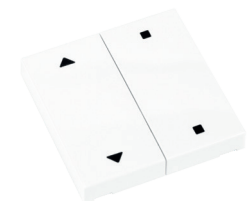
RTS23-ACC-03-xxP2 1x AUF/STOPP/ZU