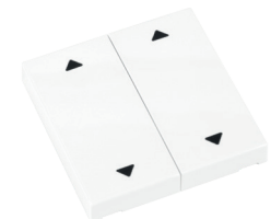
RTS23-ACC-02-xxP2 2x AUF/ZU