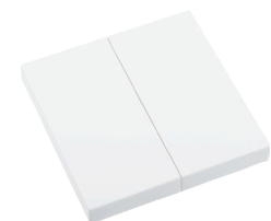
RTS23-ACC-01-xxP2 2x EIN/AUS